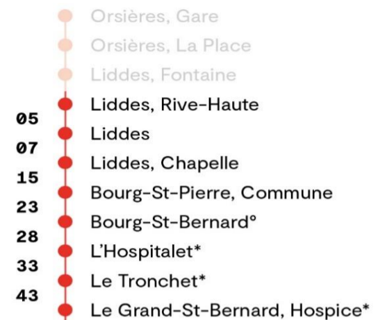
Temps de parcours approximatif en minutes