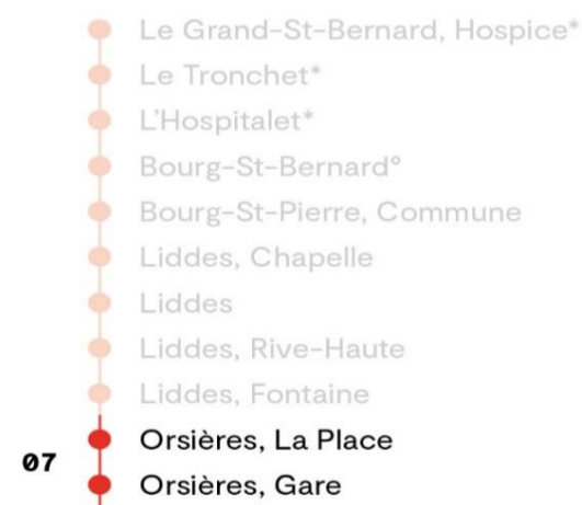
Temps de parcours approximatif en minutes

* du 02.06 au 20.06 le samedi et dimanche, puis tous les jours du 21.06 au 28.09