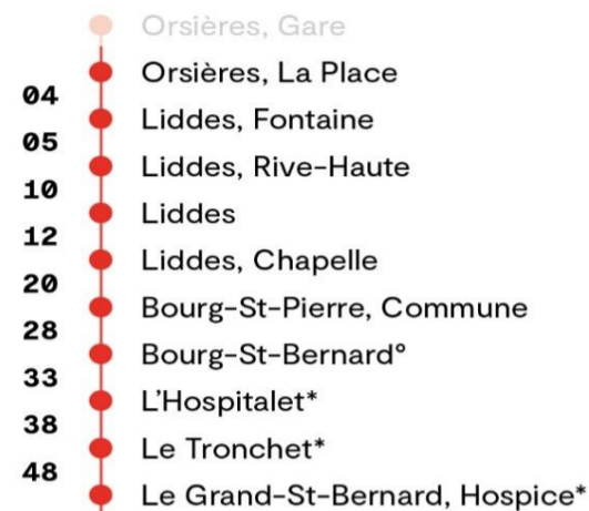
Temps de parcours approximatif en minutes

* du 02.06 au 20.06 le samedi et dimanche, puis du 21.06 au 28.09: tous les jours jusqu'au Grand-St-Bernard, Hospice