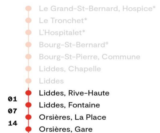
Temps de parcours approximatif en minutes